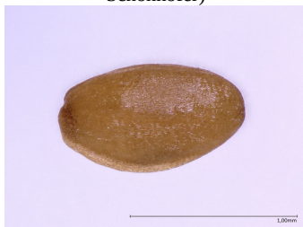
Same von Phyteuma nigrum