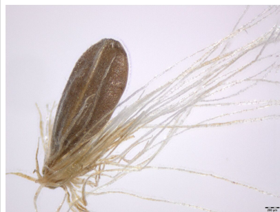
Fruchtstand und Same von Eriophorum gracile