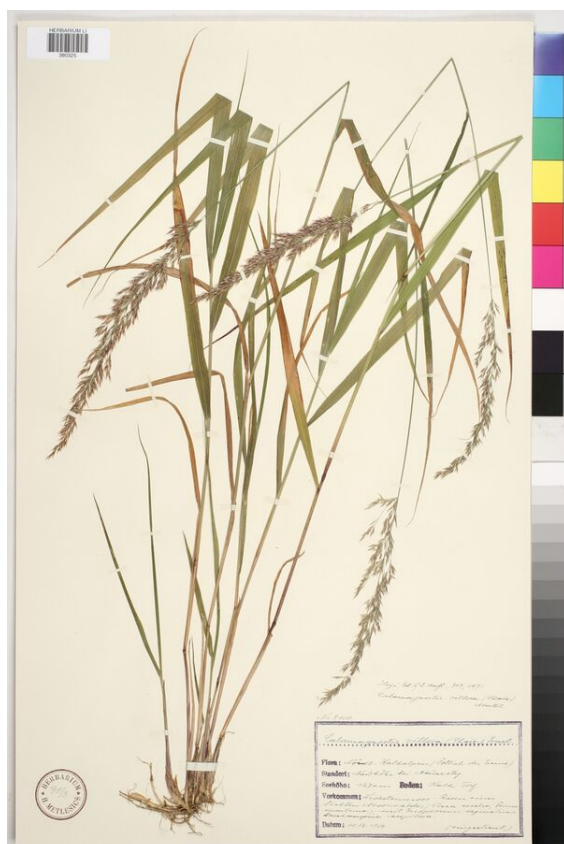
Herbarbeleg von Calamagrostis villosa